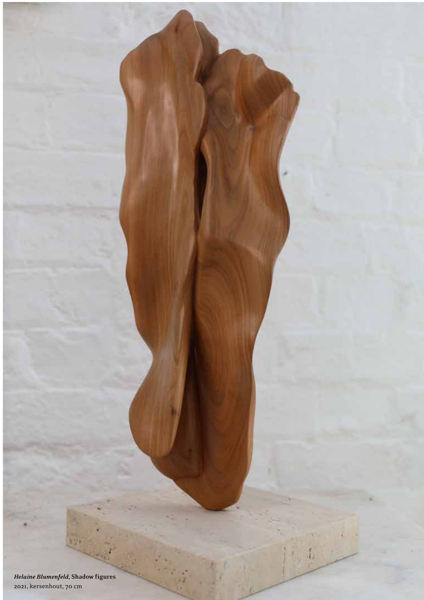
Helaine Blumenfeld, Shadow figures 2021, kersenhout, 70 cm