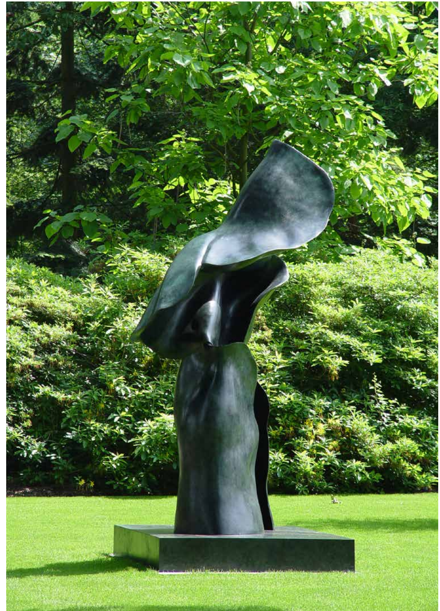
Helaine Blumenfeld, Ascent (tuin) 2007, brons, 350 cm

Ascent is op verschillende manieren uitgevoerd. Elk stuk heeft zijn eigen karakter, een vloeiende beweging in marmer of brons. In de 3,5 meter hoge bronzen uitvoering echter, een buitengewoon beeldhouwwerk dat de ruimte volledig beheerst,