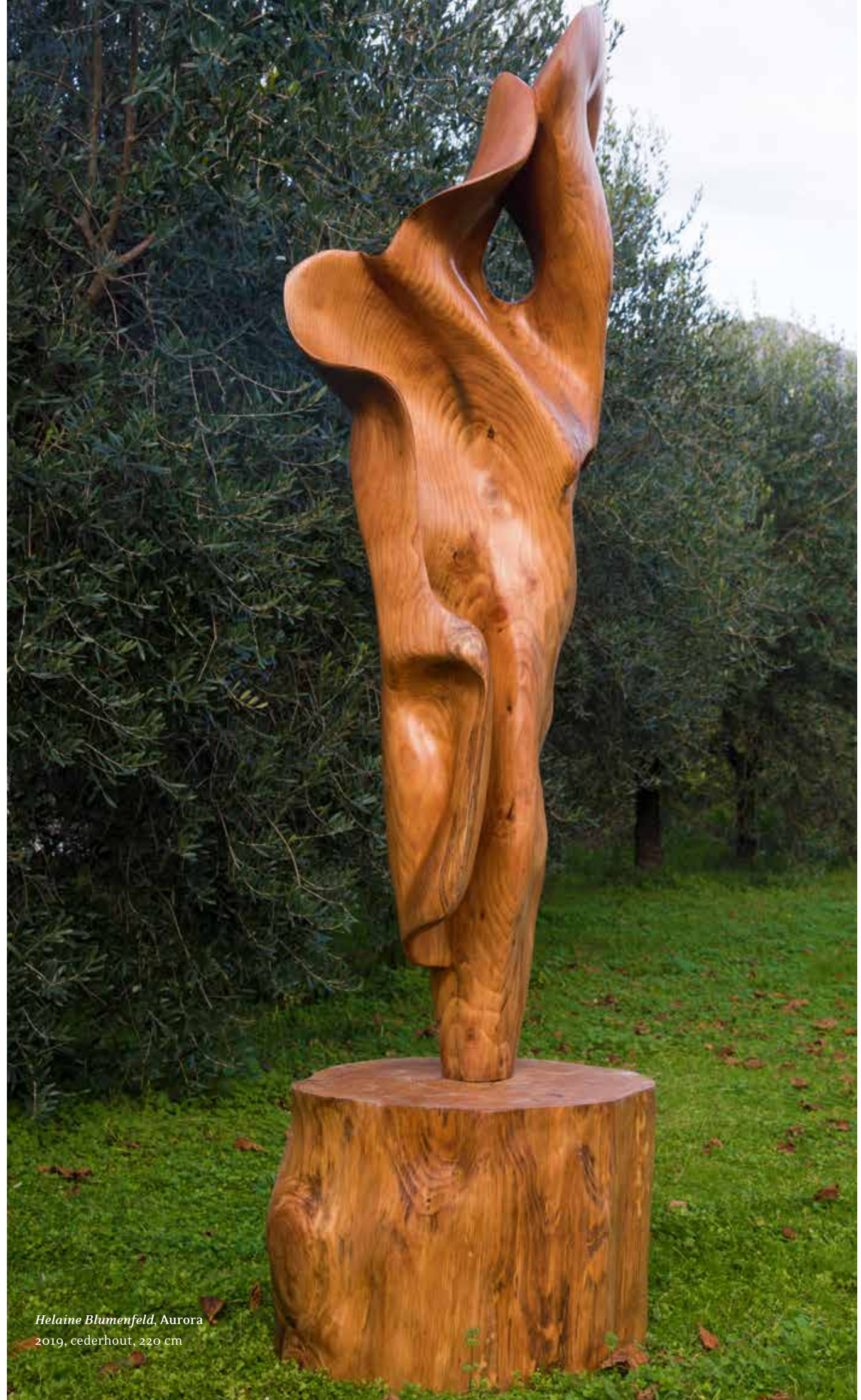
Helaine Blumenfeld, Aurora 2019, cederhout, 220 cm