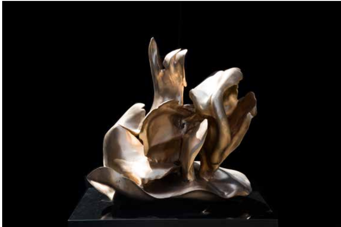
Helaine Blumenfeld, Exodus V, 2019, brons, 55 cm

In de periode van deze tentoonstelling zal een uitgebreide retro- perspectieve film over Helaine Blumenfeld door de AVRO op de Nederlandse televisie worden uitgezonden. Zodra de datum en tijd bekend zijn zullen we u via een nieuwsbrief daarover berichten.