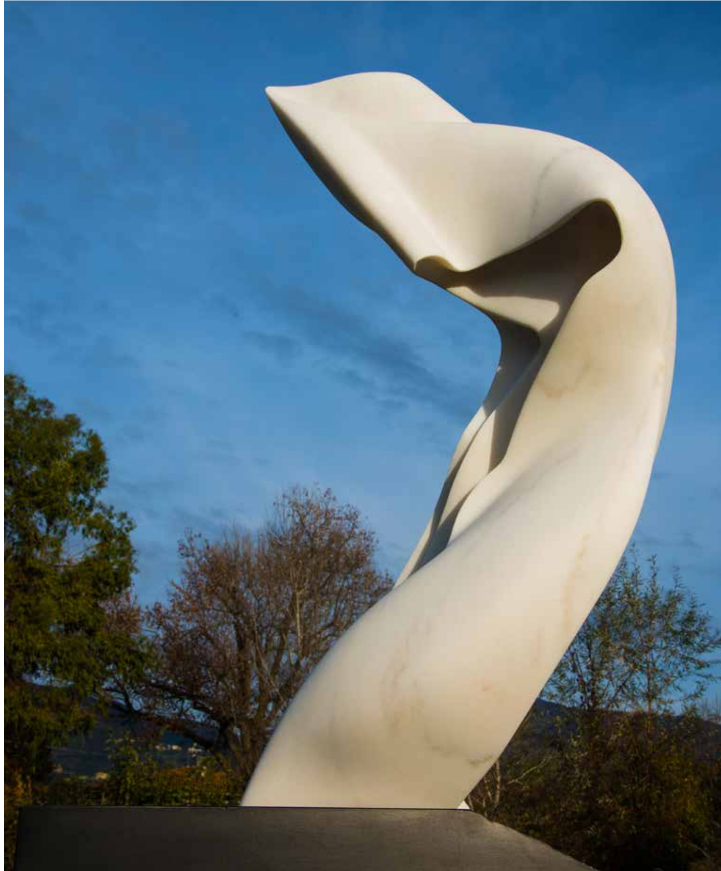
Helaine Blumenfeld, Toward the precipice 2019, marmer, 97 cm