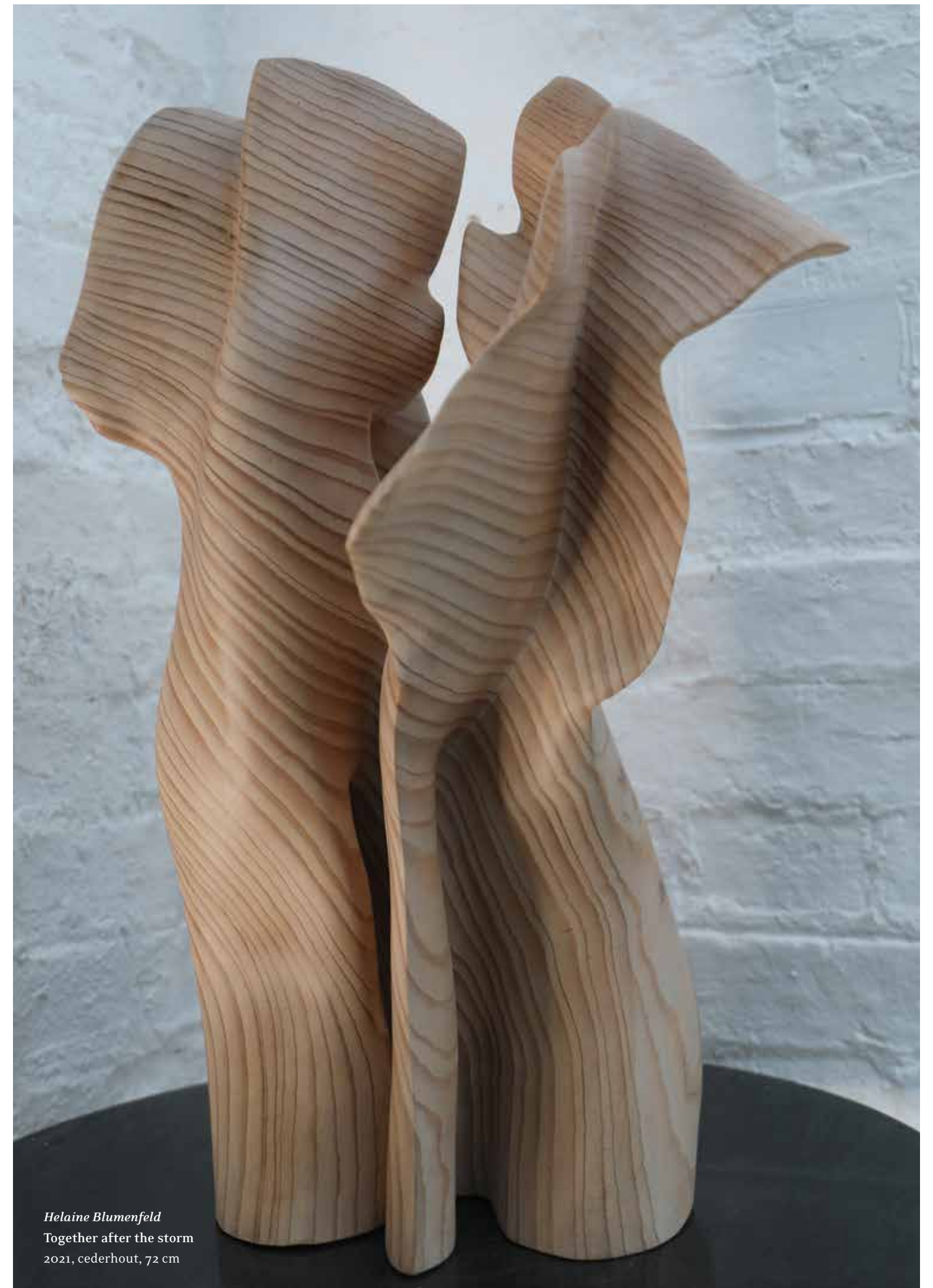
Helaine Blumenfeld Together after the storm 2021, cederhout, 72 cm